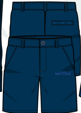
8. Pantalón niño corto 65% Poliéster 35% Algodón