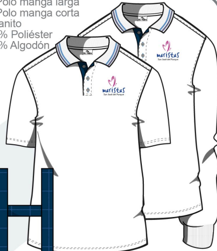
1. Polo manga larga 2. Polo manga corta Granito 50% Poliéster 50% Algodón