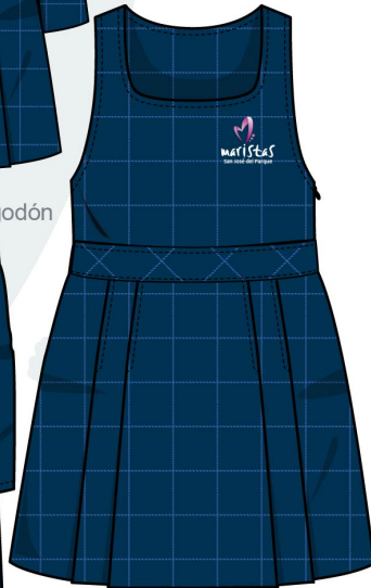
5. Pichi 1º y 2º Primaria Sarga Poliéster/Lana (Talla de 2 a 6)