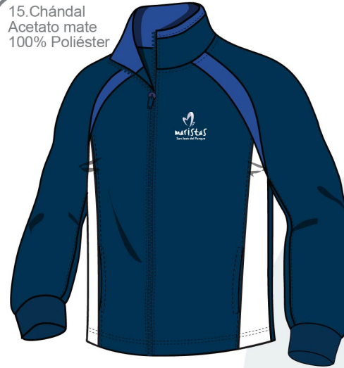
15. Chándal Acetato mate 100% Poliéster