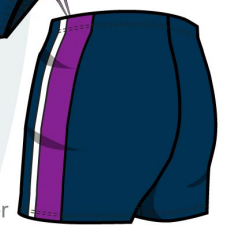
19. Boxer niño