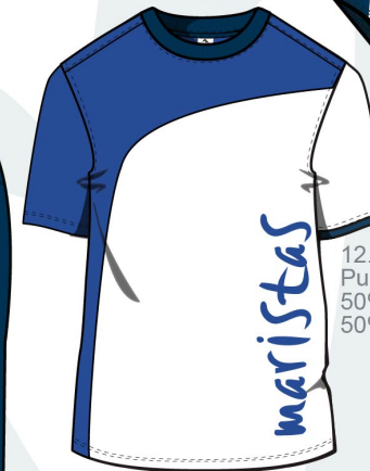
12. Camiseta Punto liso 50% Poliéster 50% Algodón