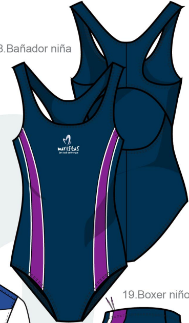
18. Bañador niña