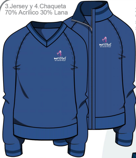
3. Jersey y 4. Chaqueta 70% Acrílico 30% Lana